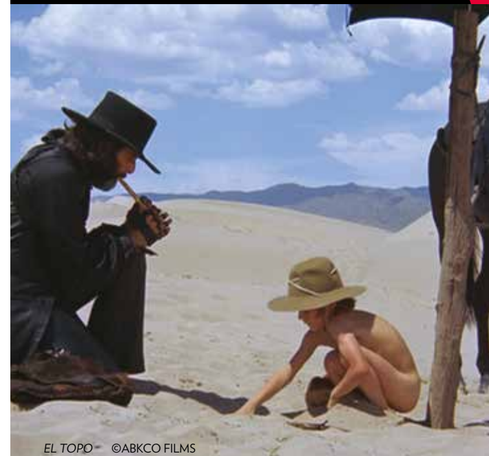
EL TOPO

ROLAND SMITH FAIT SON CINÉMA DU 16 SEPTEMBRE AU 10 DÉCEMBRE 2017