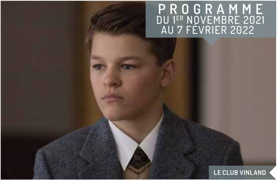
LE CLUB VINLAND

PROGRAMME DU 1 ER NOVEMBRE 2021 AU 7 FÉVRIER 2022